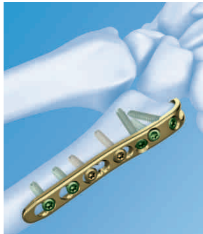
LCP Ulnare Platte 2.0