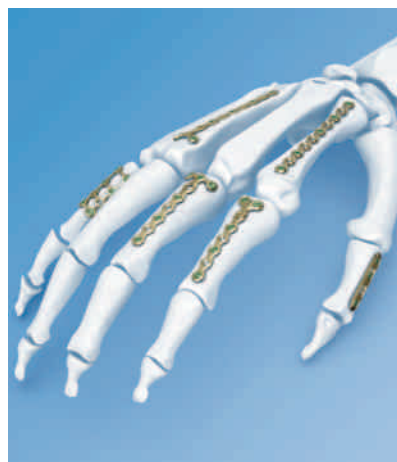
LCP Compact Hand 1.5

LCP ist ein Markenzeichen von Synthes, Inc. oder deren Tochtergesellschaften